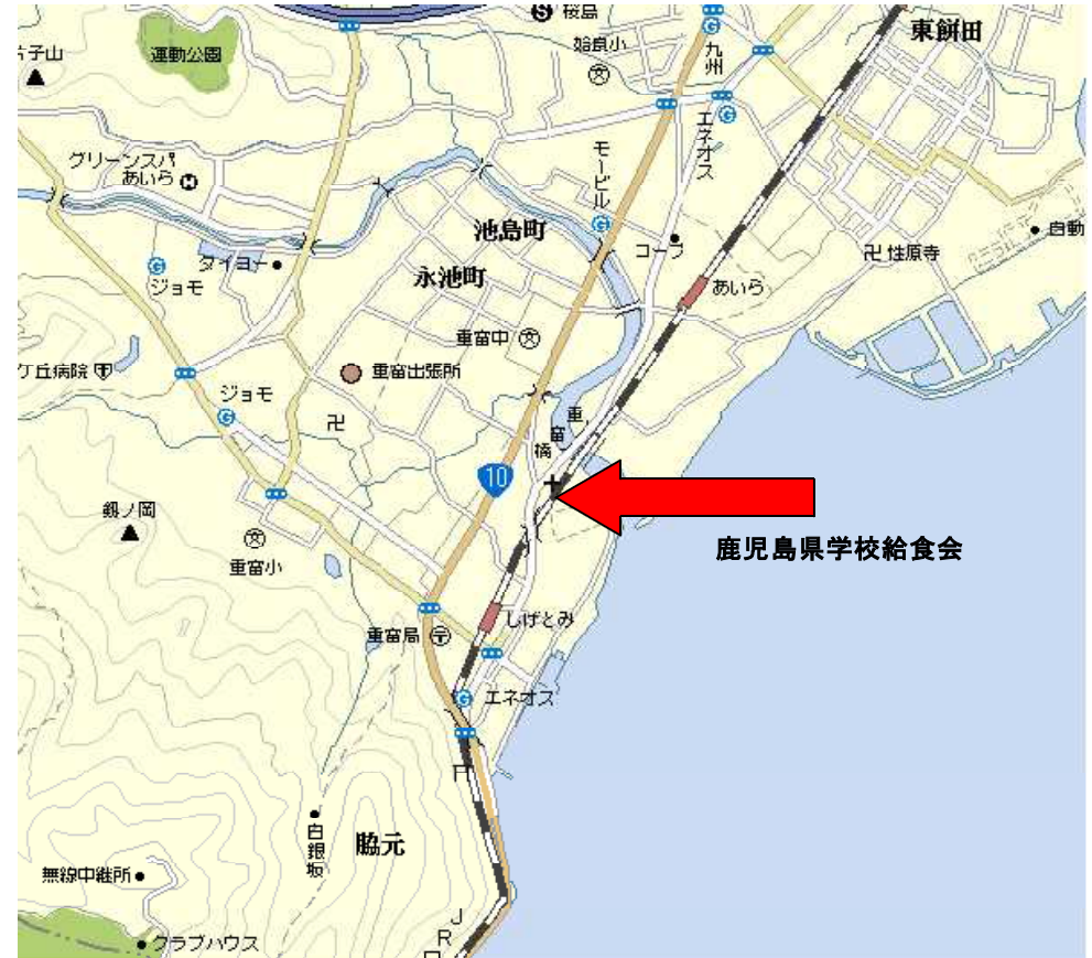
(学校給食会付近見取り図)

※ 参加申込みに係る情報に付きましては、この事業の連絡等以外に使用することは無い事を申し添えます。