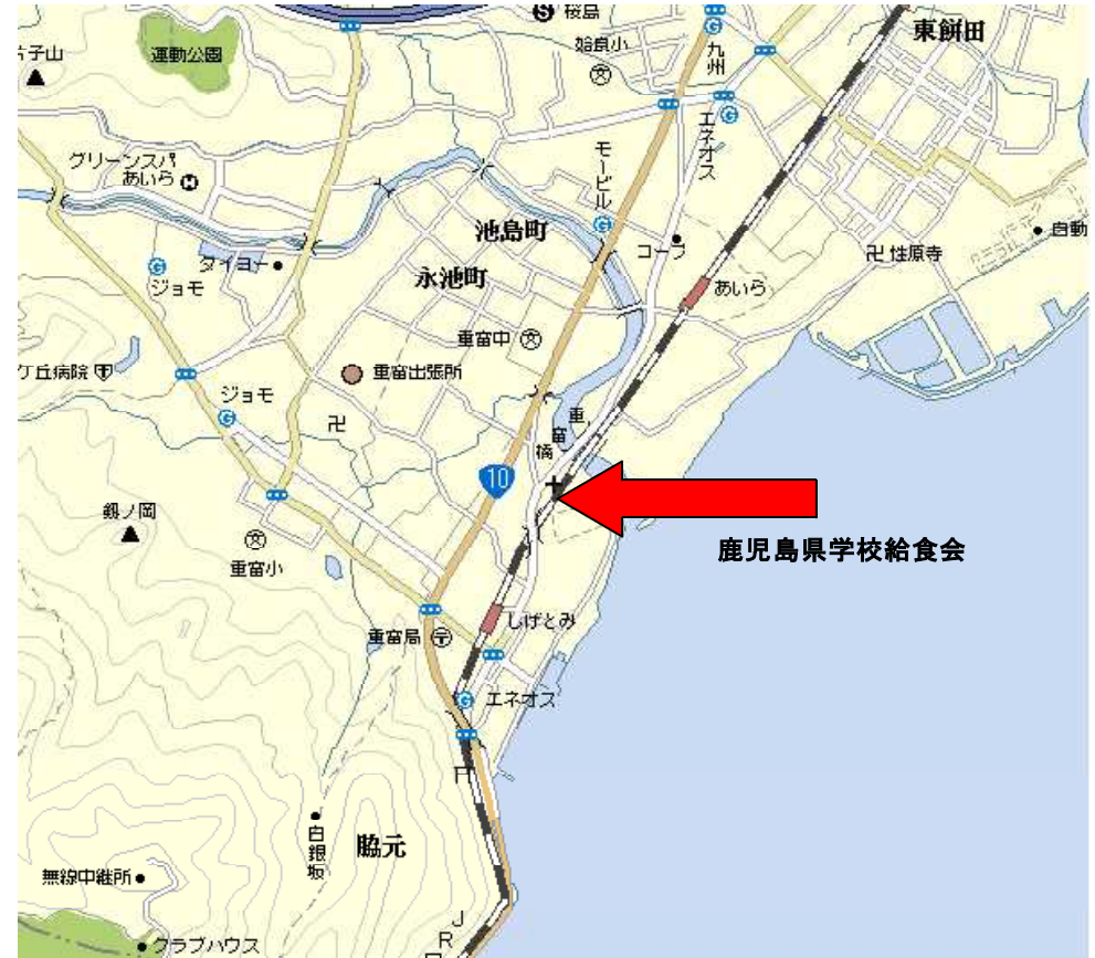
(学校給食会付近見取り図)

※ 参加申込みに係る情報につきましては、この事業の連絡等以外に使用することは無い事を申し添えます。