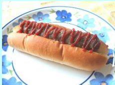
●スティックドック 【MCC食品】 50g