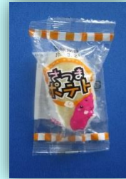
●さつまポテト 【マルイ食品】 35g