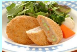
●彩り野菜とキャベツのミンチカツ 【MCC食品】 40g, 60g