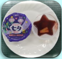
七夕ゼリー (ブドウゼリー) 40g