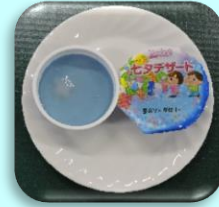
七夕デザート (星のソーダゼリー) 35g