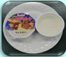
七夕デザート (ライチゼリー) 40g