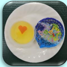
【常温】 七夕ゼリー (りんごゼリー) 50g