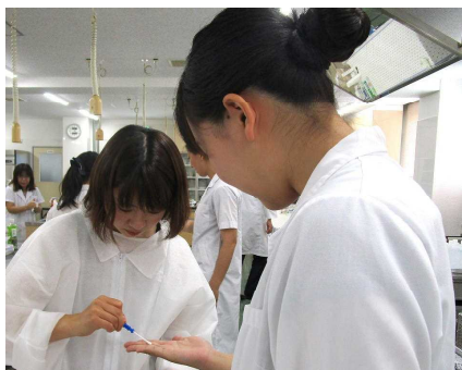
① ルミテスターで手の汚れの検査

食品衛生の基本は、「確実な手洗い」を行うことです。手洗いがおろそかになると、細菌やウイルス等を調理場に持ち込むことになり、食中毒の原因となります。そこで、手洗い指導に活用するために、手洗いが確実になされているかを3つの観点から確認する検査を実施しました。