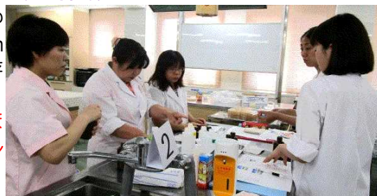
調整した次亜塩素酸Na溶液の濃度測定

ノロウイルス等の感染により、学校や調理場で嘔吐物処理や調理場内等の消毒に、次亜塩素酸Na溶液を1000ppmや200ppmに調整する必要があります。調整後の次亜塩素酸Na溶液を保存した場合、保存方法や保存期間等で濃度が変化するか検証し、調整した溶液は高温や日光により濃度が低下することが解りました。また、開封済み原液を長期間保存すると、日光を遮断した棚の中に保管しても塩素濃度は低下します。