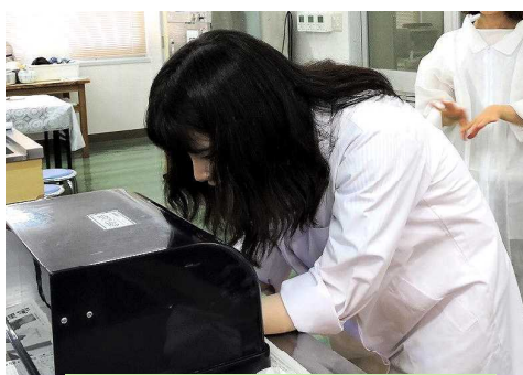
② 手洗い上手で洗い残しの検査