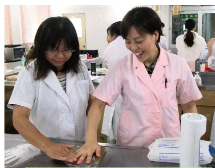
③ 手形培地を使って細菌検査