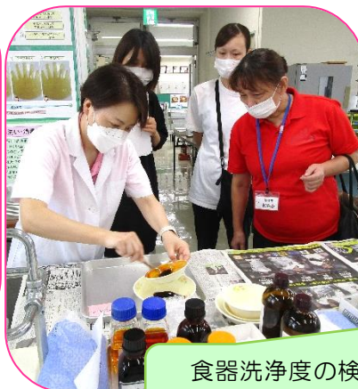
食器洗浄度の検査結果をもとに洗浄方法のアドバイスをさせていただきました。