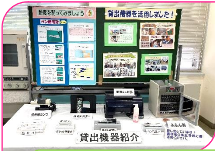
貸出検査機器やDVD教材の紹介コーナーでは、給食センターや学校での活用事例を併せて紹介しました。

7月29日に3年振りとなる“給食用物資展示会”を開催しました。食品検査室では、さまざまな掲示物をはじめ、貸出検査機器やDVDの紹介、手洗い検査の体験や食器具洗浄度検査(事前申込)を実施しました。人数や時間の制限などコロナ感染症対策を講じての開催でしたが、多くの関係者の皆様に御来場いただきました。ありがとうございました。