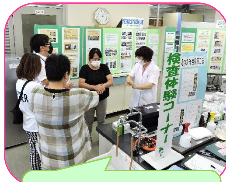
食器洗浄度検査の結果を待つ時間に手洗い検査を体験していただきました。