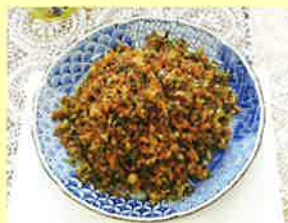
▲炒全家福 (豚ひき肉と色々野菜の漬物炒め)