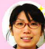
新 ・伝票担当 / 始良・南薩