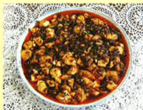
▲陳麻婆豆腐とご飯 (陳建一のマーボードーフとご飯)