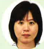
外菌 ・庶務担当 ・伝票担当 / 鹿児島