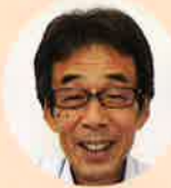
森 課長 ・課の総括

商品案内や食育支援事業を行っています。栄養士もおりますのでご相談もお待ちしております。