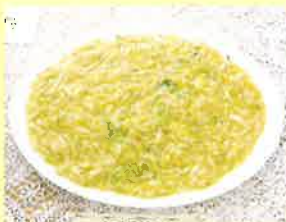
▼干貝烩白菜 (貝柱の旨みたっぷり白菜の煮込み)