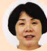
木原 ・食育支援・講習会 ・物資委員会・献立集