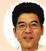
上之 ・商品案内 ・契約関係