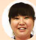
向江 ・商品案内 ・食指導資料貸出 ・伝票担当 / 北薩・出水