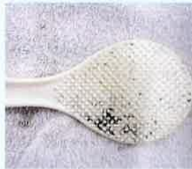
▲残留でんぷんの検査 検出箇所は青色を呈します。

本会では現在、残留でんぷんと残留脂肪について食器具の検査を行っております。ご依頼については、本会食品検査室にお問い合わせいただくか、本会ホームページ（安全衛生の食品検査室のページ）をご活用ください。