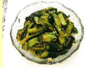
▼豆板拌黄瓜 (きゅうりの豆板醤和え)