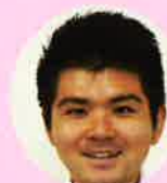
折田 ・常温仕入れ ・伝票担当 / 鹿児島