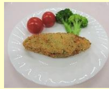
〈ホキフライ(青さ入)〉 【福岡丸福水産】