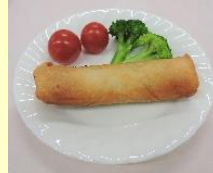
〈春巻 Fe(米粉入り)〉 【ニチレイフーズ】