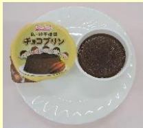
〈チョコプリン(乳・卵不使用)〉 【トーニチ】