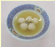
〈中華風つくね〉 【マルイ食品】