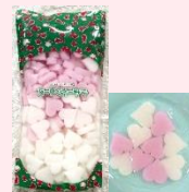
●ハート型杏仁豆腐 ミックス 1kg (固形量650g)