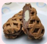
●原宿ドッグミニ (コアバ ナ Fe) 40g