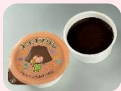
●チョコプリン (アレルゲン28品目不使用) 40g