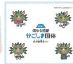
●鹿児島県産手巻のり(国体) 4つ切3枚入 4つ切4枚入