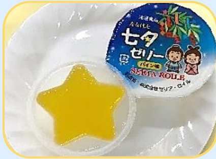
★冷凍七夕ゼリー (パイナップル味) 40g