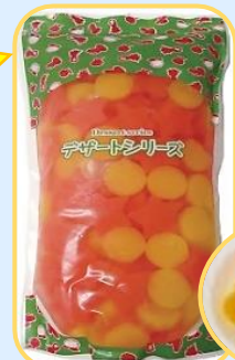
★月型星型ゼリーミックス 1kg (固形量 650g)