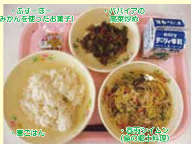
ジオパクパク給食