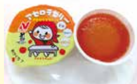
アセロラゼリー （Fiber&Fe入り） 40g 【ニチレイフーズ】