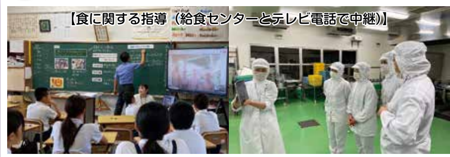
【食に関する指導（給食センターとテレビ電話で中継）】