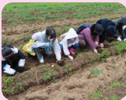
じゃがいもの収穫体験