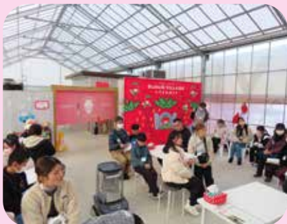
サナスビレッジでのいちご狩り体験

今回の「食のふるさと探検隊」が鹿児島県の水産物及び農産物に興味を持つきっかけとなり、本県の産物に対する子どもたちの理解が一層深まれば幸いです。