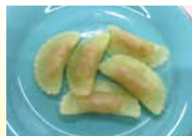
ラビオリ 1kg 【大冷】