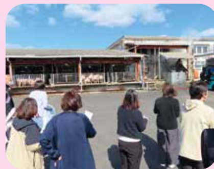
(株)JA 食肉かごしま南薩工場