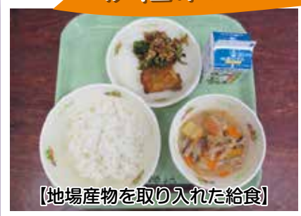
【地場産物を取り入れた給食】