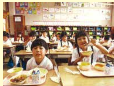
ジオパクパク給食を食べる児童