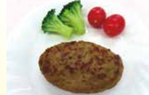
国産ミートのハンバーグCa&Fe 40g・60g・80g 【ニチレイフーズ】