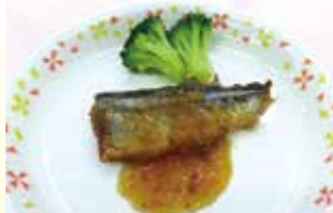
さんまみぞれ煮 40g×10・50g×10 【津田商店】

九州地区共通選定品とは、九州各県から選ばれた物資委員の先生方と味・価格・調理所見等について協議を重ね、選ばれた商品です。九州8県の学校給食会が共同購入を行うことで通常価格よりも安価に提供することができます。この機会に是非ご利用ください。