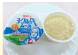
冷凍ヨーグルップムース 40g 【セリア・ロイル】