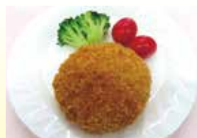
大豆とごぼうの ミンチカツ（Fe・Ca） 40g・60g 【MCC食品】