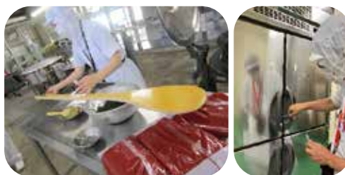
【訪問衛生検査】拭き取り検査の様子

衛生リスクに関する最新情報や食品衛生分野の知識を発信し、学校給食の適切な衛生管理の実践と食品の安全確保を支援しています。