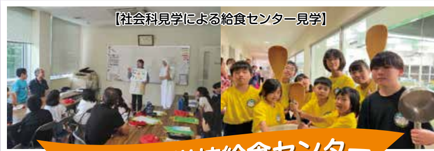
【社会科見学による給食センター見学】