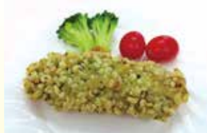
ホキ天玉揚げ（青さ入） 40g・50g 【福岡丸福水産】