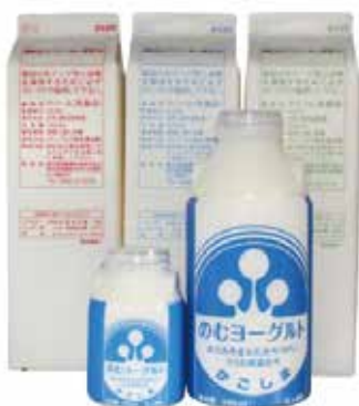
生クリーム・ヨーグルト