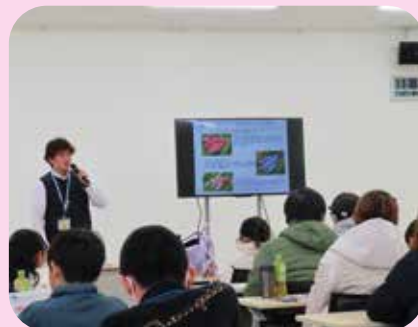
南さつま市職員による魚のお話